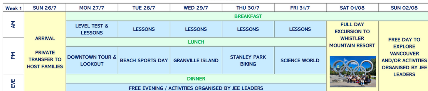
WEEKLY SAMPLE PROGRAMME

CES Vancouver reserves the right to substitute any of the activities of equivalent value based on availability and weather conditions